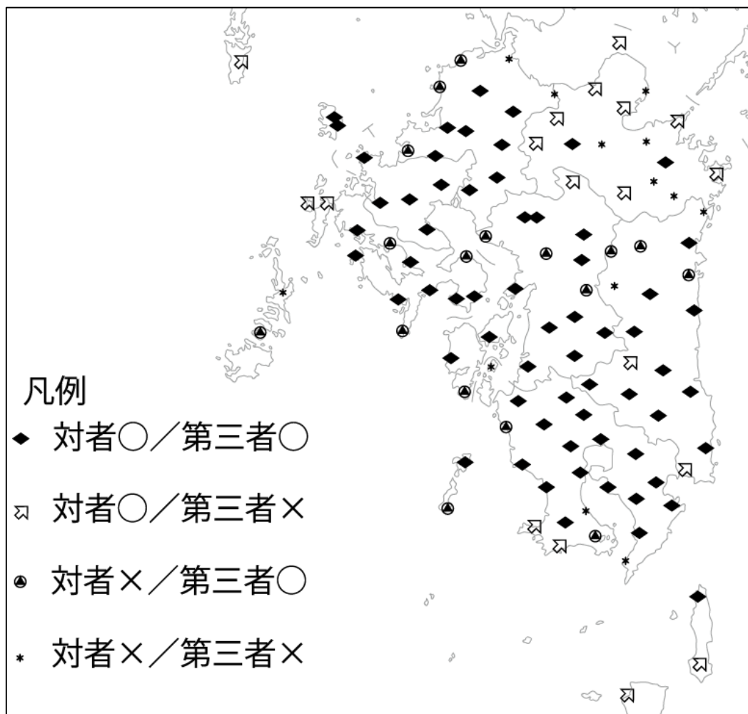
図1 九州方言における敬語運用の類型

本発表の分析では、上記調査文で得られた回答の「行くのか」にあたる箇所敬語形式が使用されているか否か、使用されている場合いずれの敬語形式が使用されているかといった観点からデータを処理し、地図化した。なお、併用回答がみられた地点では使用する敬語形式が異なる場合のみ採用し、準体助詞の有無や終助詞の違いは捨象している。この観点による分析から、敬語運用のタイプは、対者待遇・第三者待遇ともに敬語形式を使用する(◆)、対者待遇では敬語形式を使用するが第三者待遇では敬語形式を使用しない(☒)、対者待遇では敬語形式を使用しないが第三者待遇では敬語形式を使用する(●)、対者待遇・第三者待遇ともに敬語形式を使用しない(*)といった4つのタイプに分けられる。結果は図1の通りである。